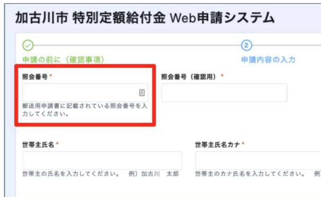
右：加古川市版オンライン申請フォーム